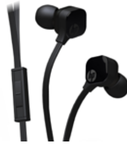
H6T14AA#ABB Leuchtend schwarz