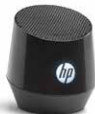
H5M95AA#ABB Leuchtend schwarz