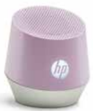
H5M98AA #ABB Pink