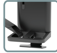
FLACHE TISCHKLEMME 98-490-224 (MATT-SCHWARZ)