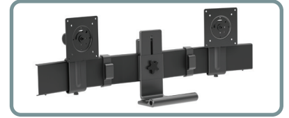
VON EINZEL- AUF DUAL- SCHIRMLÖSUNG 47-110-224 (MATT-SCHWARZ)