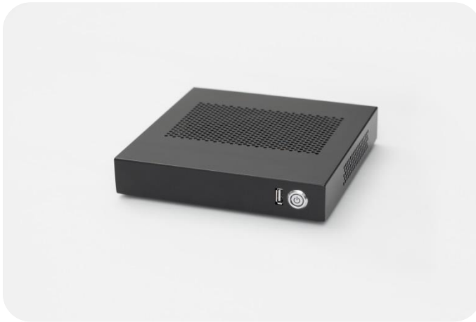
KYOappliance Drive | Image (Vorderansicht)