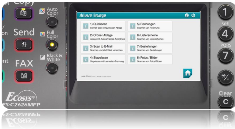
Screenshot der acht Scan-Workflows auf dem Bedienfeld des KYOCERA MFPs (HyPAS) mit angebundener KYOappliance Drive | Image

Bewährte Scan- und Capture-Lösung mit intuitiver Bedienung. Keine aufwändigen Schulungen erforderlich. Die übersichtlich und benutzerfreundlich organisierte Oberfläche am MFP Panel ist nicht nur einfach zu verstehen und zu nutzen, sondern garantiert auch eine konsistente Arbeitsoberfläche auf allen eingesetzten MFPs im Unternehmen.