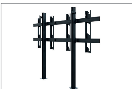
geringer Platzbedarf dank Boden Wand Montage