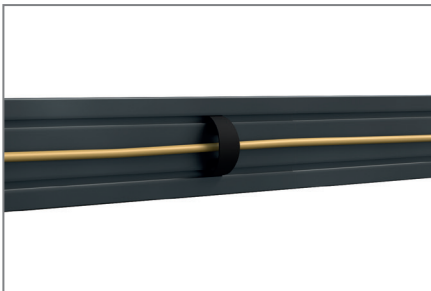
Kabelführung mittels Clips

Neben den vorkonfigurierten Systemen bietet HAGOR kundenspezifische Sonderlösungen im LED-Bereich an, welche abgestimmt auf alle Bedürfnisse mit Zubehör wie z. B. Lautsprechern, Steuerungen etc. individualisiert werden können.