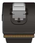
SAS 36 Pin