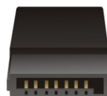
4 x SATA 7 Pin